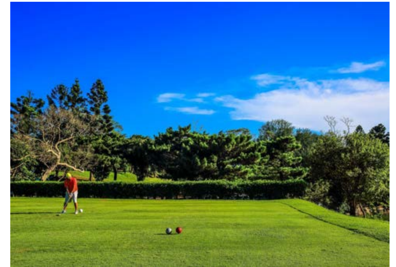
▼台灣高爾夫俱樂部